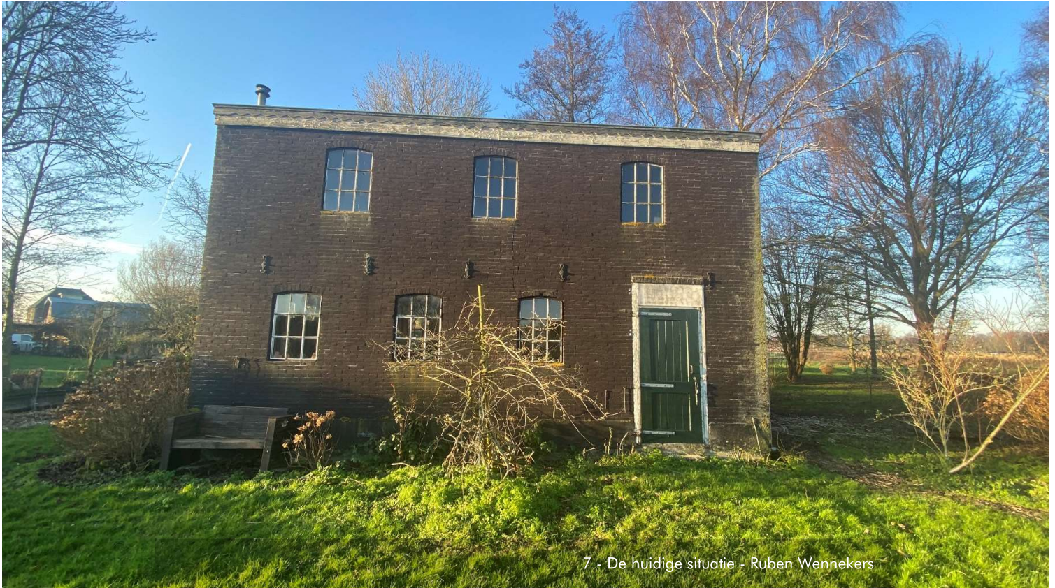
7 - De huidige situatie - Ruben Wennekers