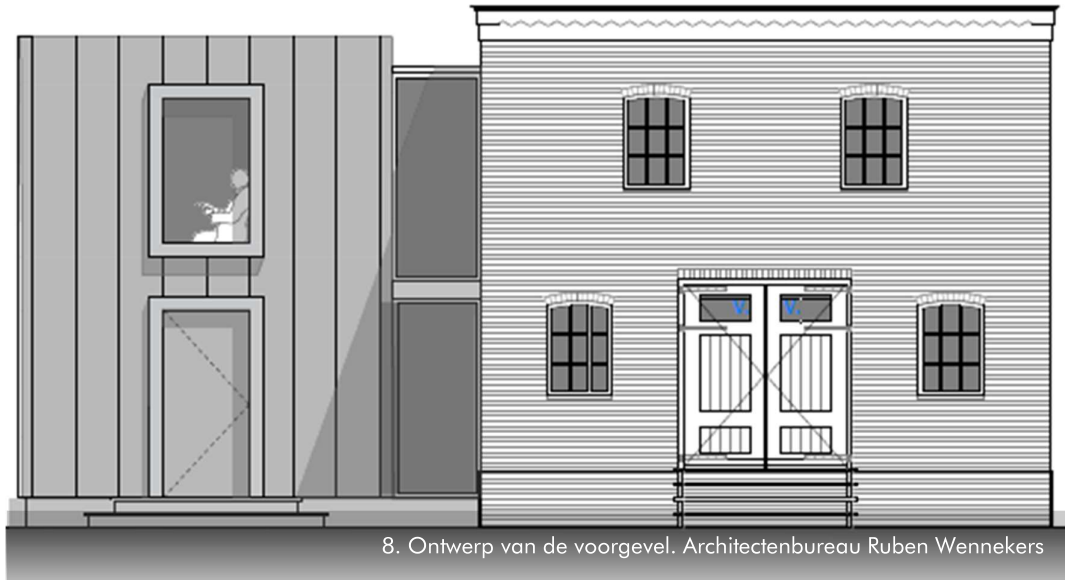
8. Ontwerp van de voorgevel. Architectenbureau Ruben Wennekens

genomen door het tussenlid te verbreden en door deze volledig in glas uit te voeren. Ook worden de kopse gevels van het tussenlid meer naar binnen geplaatst.