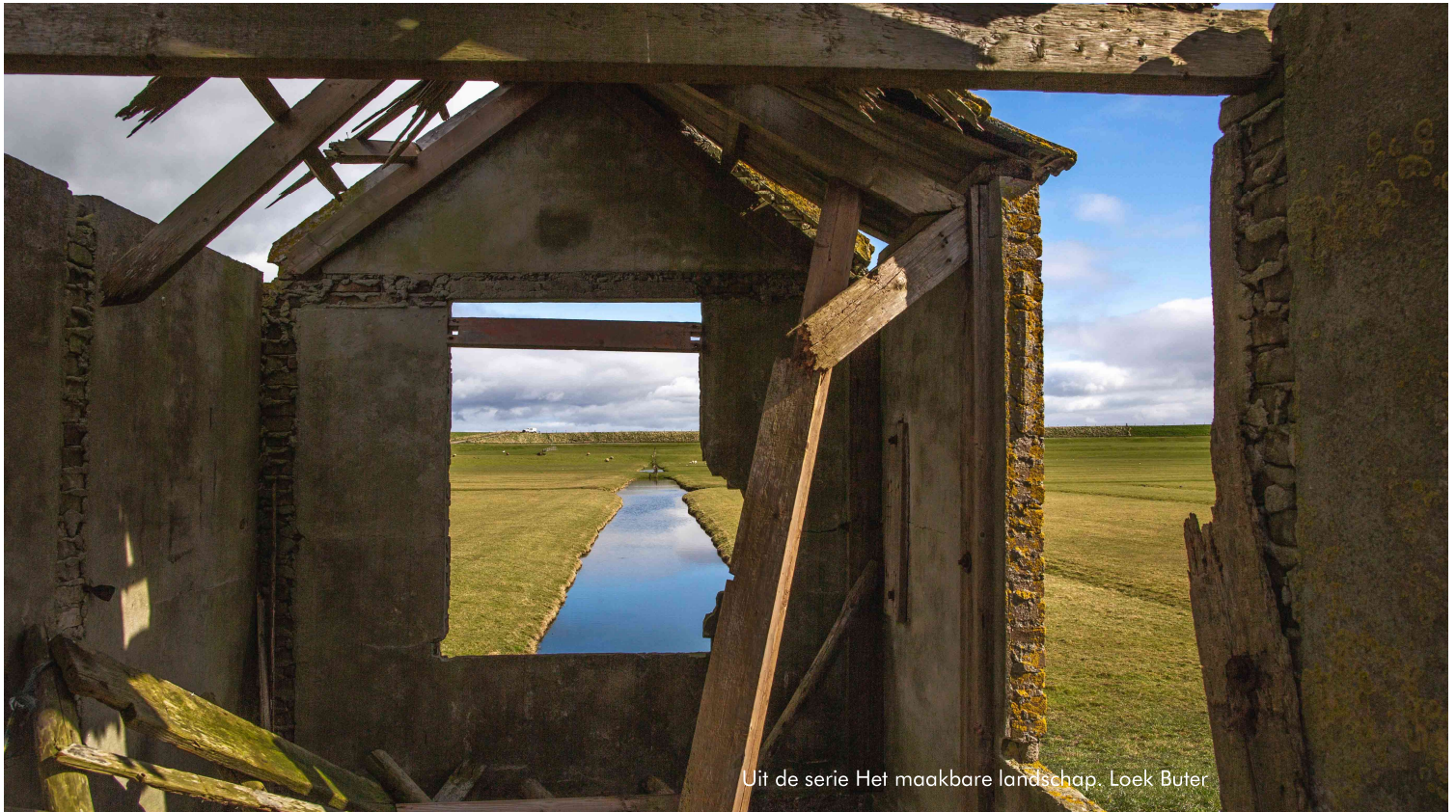
Uit de serie Het maakbare landschap. Loek Buter