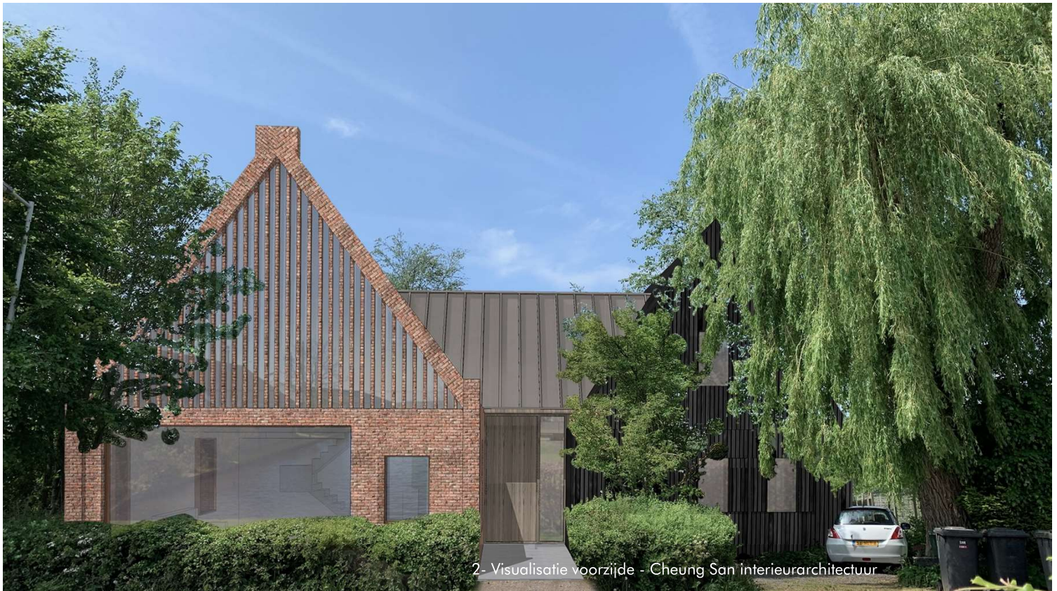
2- Visualisatie voorzijde - Cheung San interieurarchitectuur