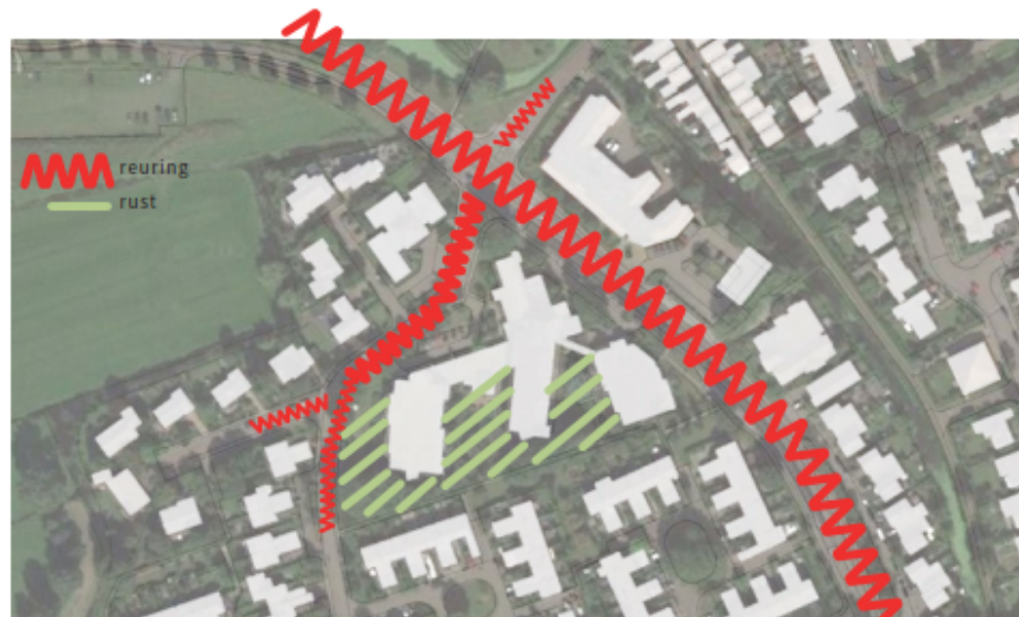
Rust versus reuring