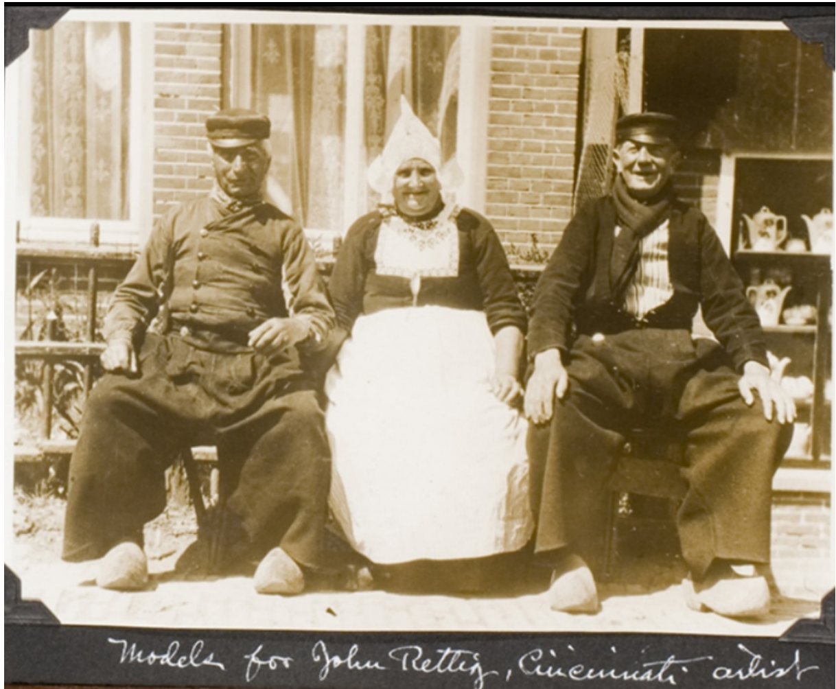
Models for John Rettig, Cincinnati artist