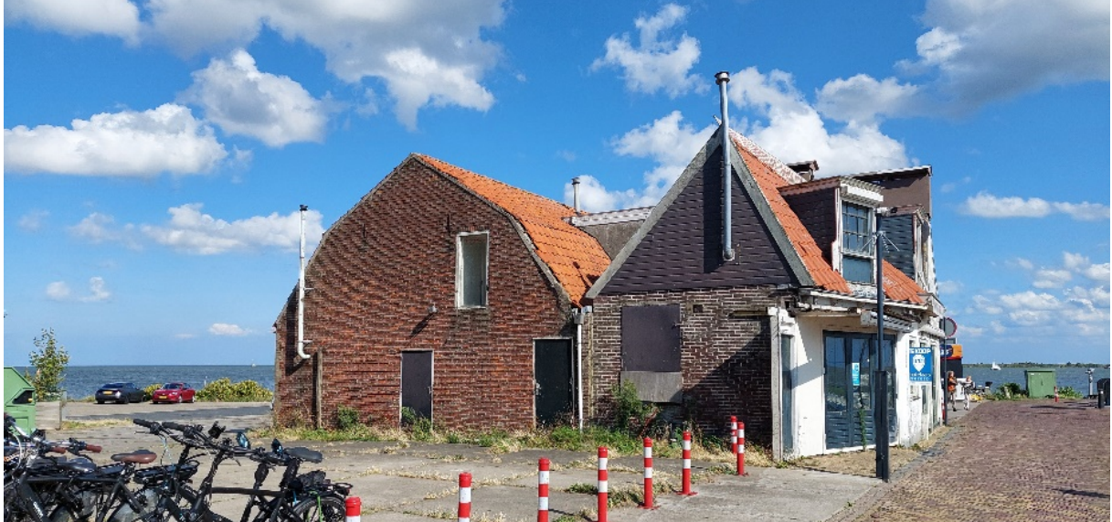
Huidige situatie per 25-08-2024

Het adres was vroeger Wijk VII nummer 78, nu is het Havendijkje nummer 2. Het rokerijtje met voormalige atelierwoning erachter en eraan vast heeft dringend onderhoud en een beschermende monumentale status nodig. Het is een van de weinige bewaard gebleven panden met een atelierverleden uit de tijd van de kunstenaarskolonie. Actie gewenst!