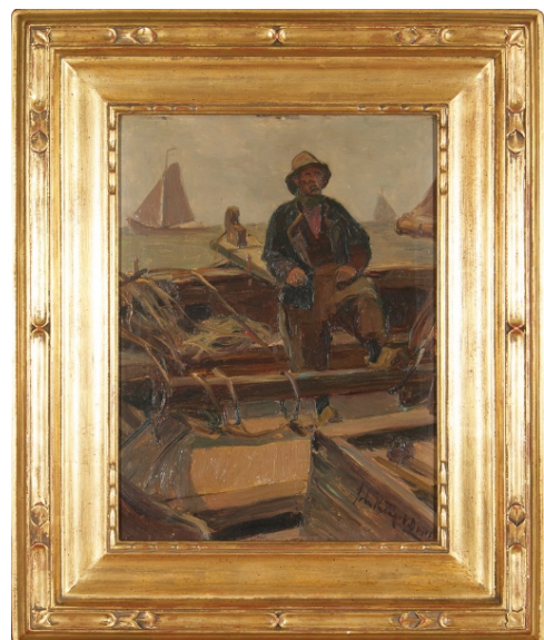
Schipper aan het roer van zijn botter, olieverf op paneel, VD 1907