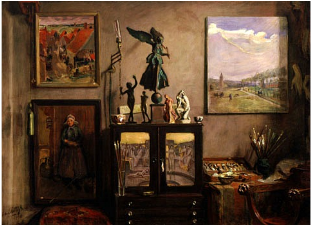
Het atelier van John Rettig. Links een schilderij van een Volendams meisje. Rechts zijn schilderdoos en kwastenpot.