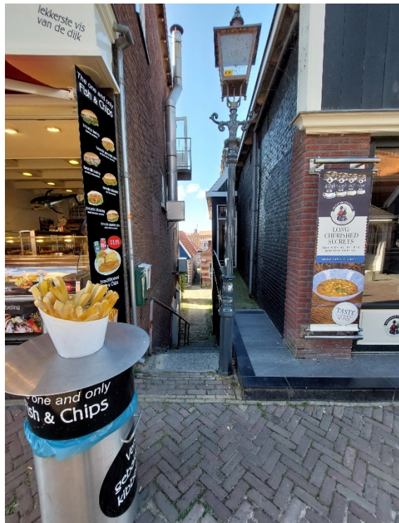
Dezelfde plaats in augustus 2024, op de achtergrond geen molen van de Meereboer meer, maar een C2000-zendmast voor nooddiensten nabij de bibliotheek, die boven de daken van Doolhof en achterliggende Oude Kom uitsteekt.