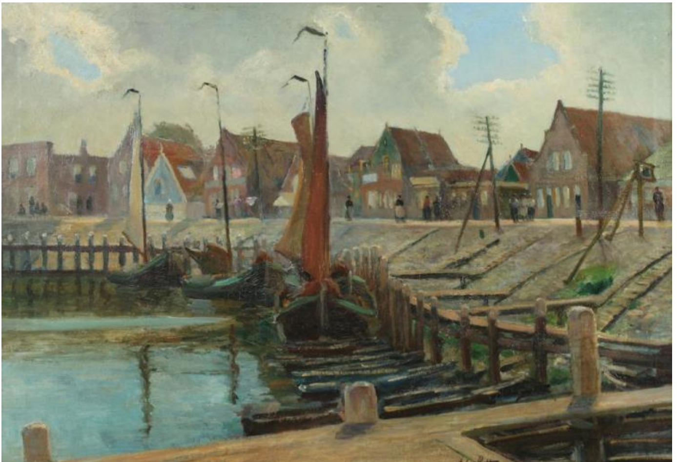
John Rettig, De Dijk, olieverf op doek, 1925