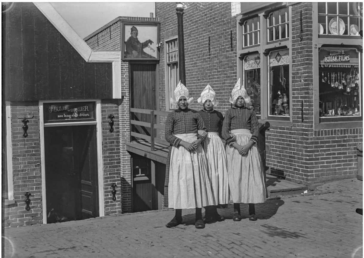
In het pand rechts begon de Karel Simons later een winkel in schilders benodigheden, met grote letters stond er "ART STORE" op het dak geschilderd. Ook kregen kunstenaars de mogelijkheid om er te exposeren.