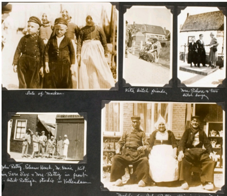
Sale of market