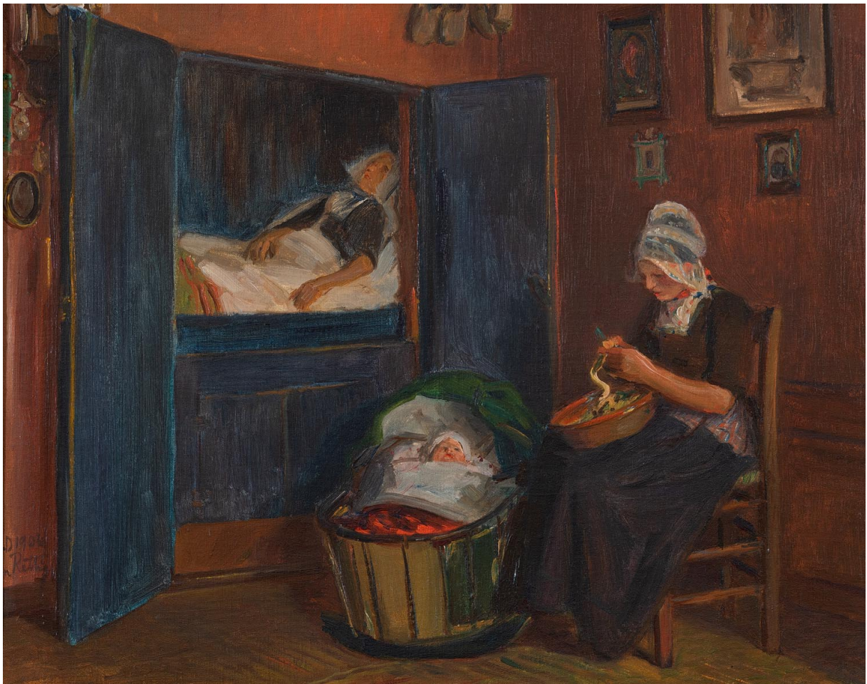
John Rettig, De Nieuwe Baby, olieverf op doek, 41 x 51 cm, particuliere collectie