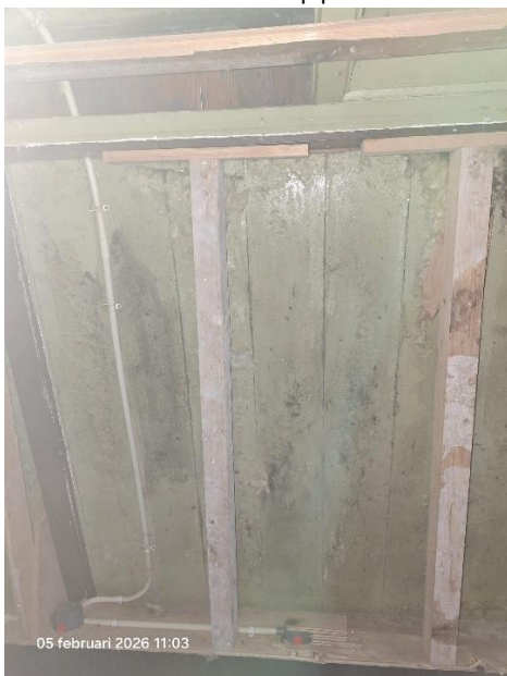
Foto van zwarte schimmel op de muren