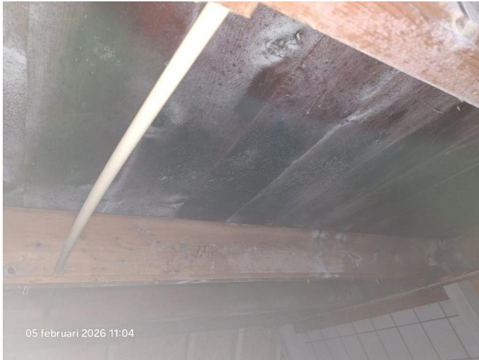
Foto van schimmel op het plafond

Inmiddels zit de gehele bovenverdieping onder de schimmel waardoor de situatie heel erg aan het verergeren is doordat er zeer veel schimmel groeit, zie foto's.