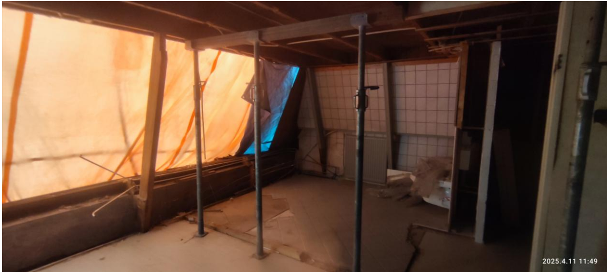
Foto afgebroken dak achter.

Wij ontvingen het besluit rond 10:30 op 11 april 2025. Zie datum notitie in afbeelding voor het moment waarop de foto's zijn genomen.