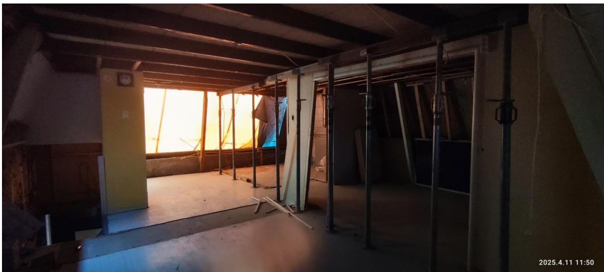
Foto Gehele eerste verdieping die is afgebroken.