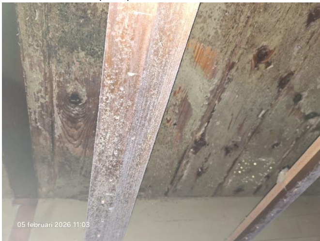
Foto van zwarte schimmel op plafond